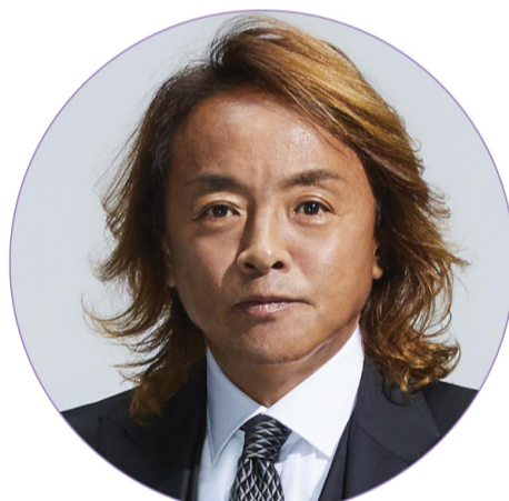
(一社) 日本障がい者サッカー連盟会長 (公財) 日本サッカー協会理事 北澤 豪 氏

スポーツ選手等によるメンタルヘルスに 関する対談の様子をYouTubeで生配信！