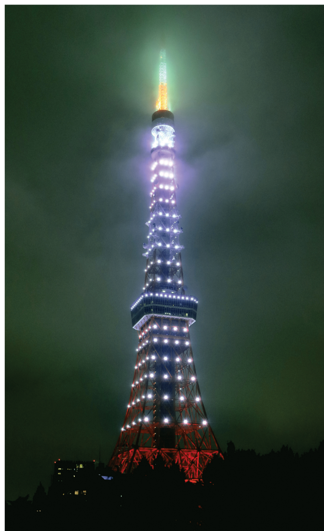
昨年度の東京タワーシルバーライトアップの様子